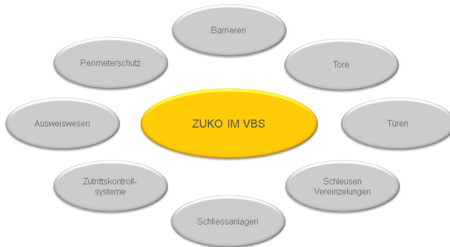
Abbildung 1 Themen ZUKO

Nachfolgende Darstellung zeigt die Themen der Beratertätigkeit: